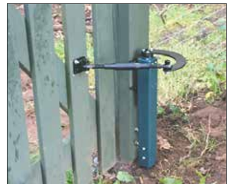
Her ses selve lågeåbneren, monteret på lågestolpen.

systemet bio-nedbrydelig hydraulikolie, der er godkendt til brug i nærheden af vandløb og skovarealer.