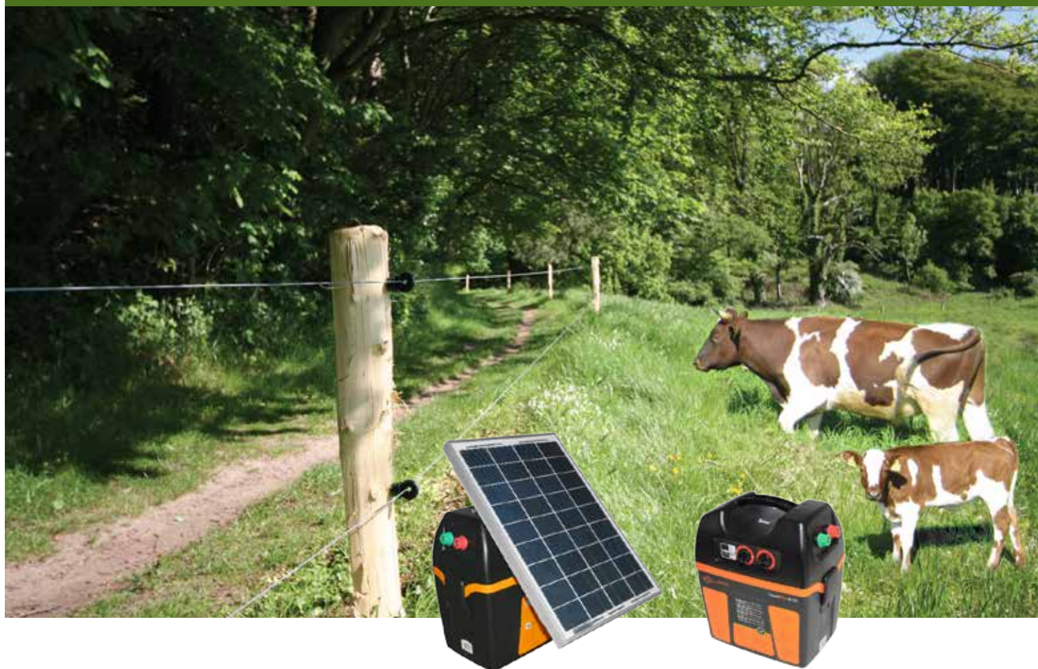
Kraftig batterispændingsgiver med stort kabinet til 12V akkumulator og mulighed for montage af solpanel.