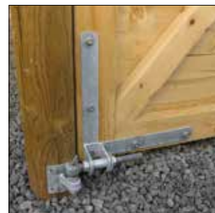
De kraftige, varmgalvaniserede beslag kan justeres i alle dimensioner.