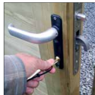
Rustfrit lukketøj med kvalitetslås giver høj komfort og øget sikkerhed.

dit lågeparti. Låge- og portdesignet matcher Podas populære Lund- og Skovbo-hegn og monteres på kraftige Ø16x300cm bærestolper, der fås med udfræsning til lægter. Porten leveres desuden med en solid, varmgalvaniseret skudrigel og stop i egetræ.